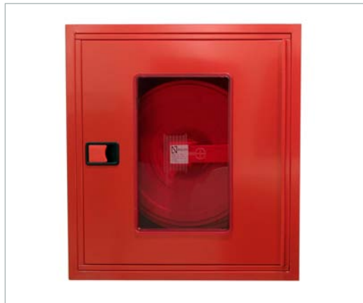
BIE 25 Acabado en rojo RAL 3000, con puerta premarco plano