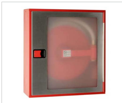
BIE 25 Acabado en rojo RAL 3000, con puerta acristalar inox