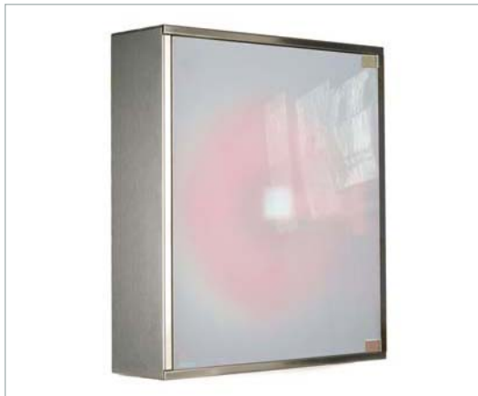
BIE 25 Acabado inox con puerta de cristal 3+3